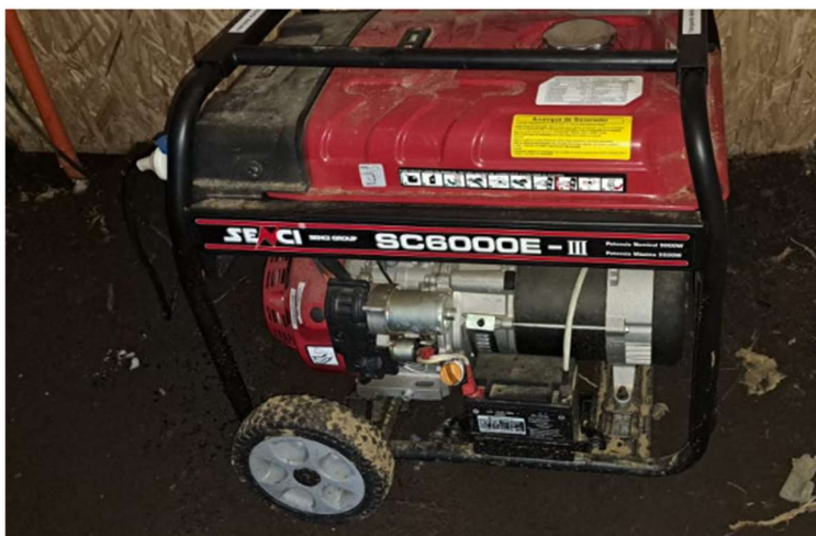
Figura 6. Generador a combustión existente