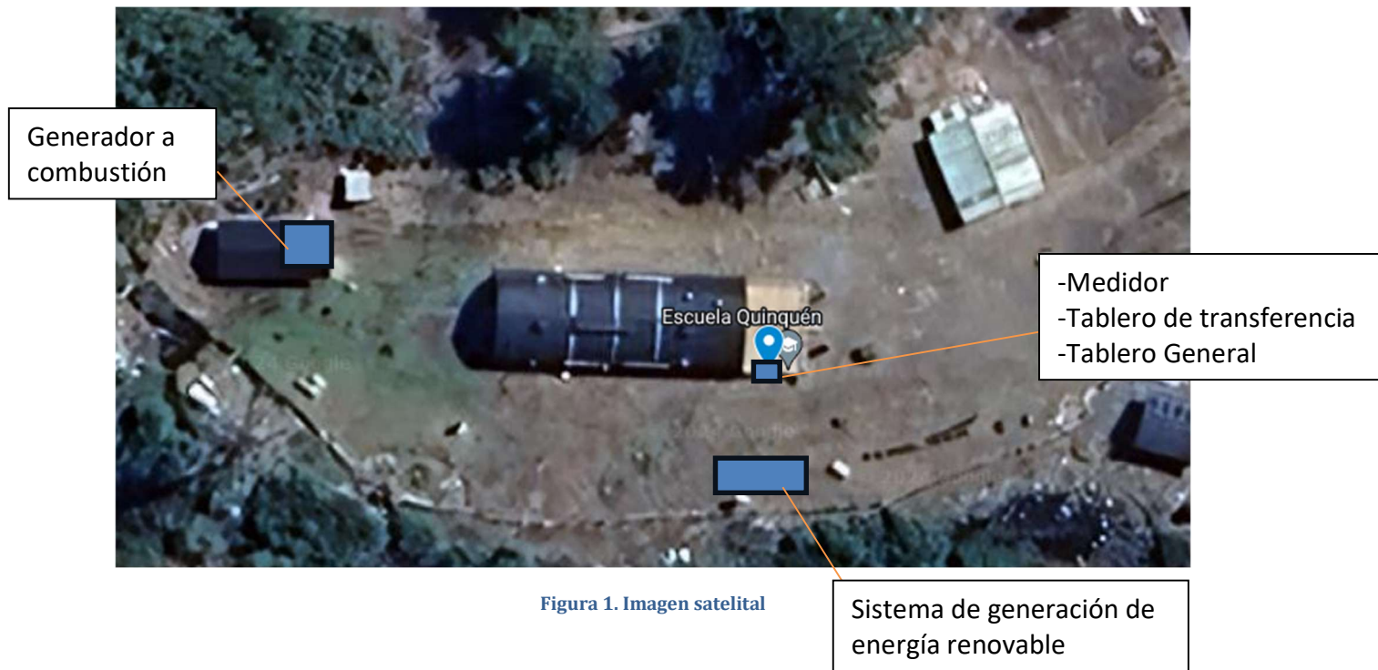
Figura 1. Imagen satelital