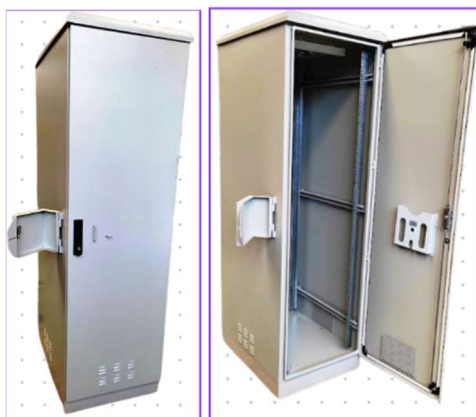
Figura 7. Referencia de gabinete contenedor de equipos para exterior (IP55 o superior, ventilación de salida forzada, filtros de polvo en ingreso de ventilación)