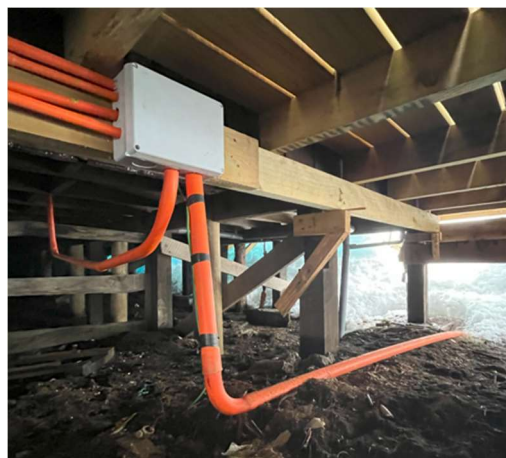
Figura 4. Caja derivaciones a normalizar (por donde pasan actualmente los subalimentadores desde el TG)