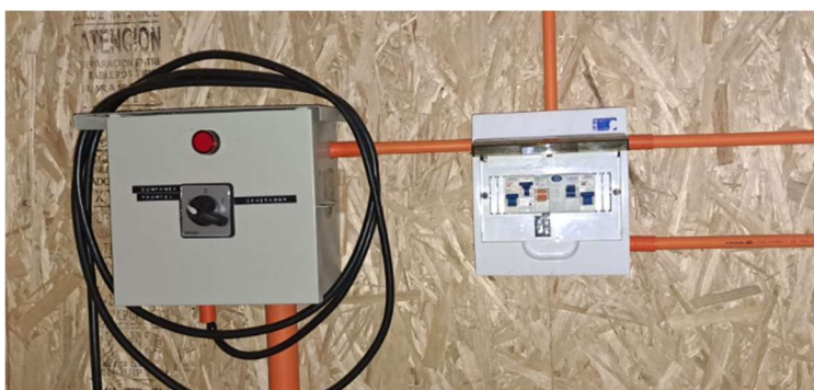
Figura 7. Actual Tablero de Generador y TD3 (selector de transferencia se proyecta en Tablero de Transferencia junto a TG proyectado) Tubería gruesa contiene 4x conductores RVK 10mm 2 que serán usados como i) subalimentador Tgenerador a TT, ii) subalimentador TG a TD3.