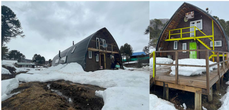
Figura 2. exterior recinto Escuela Internado