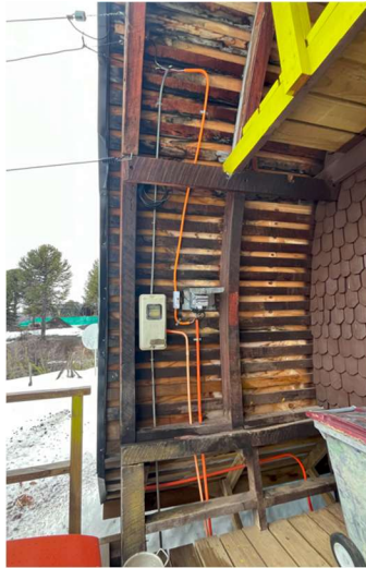
Figura 3. Medidor existente / lugar donde se proyecta Tablero General y Tablero de Transferencia NOTA: Se observa un remarcador por donde se extrae energía hacia una instalación de Faena cercana, se proyecta enchufe hidrobbox junto al TG proyectado para entregar energía a dicho remarcador.